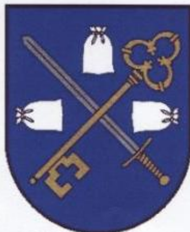
Herb Gminy Pieniężno