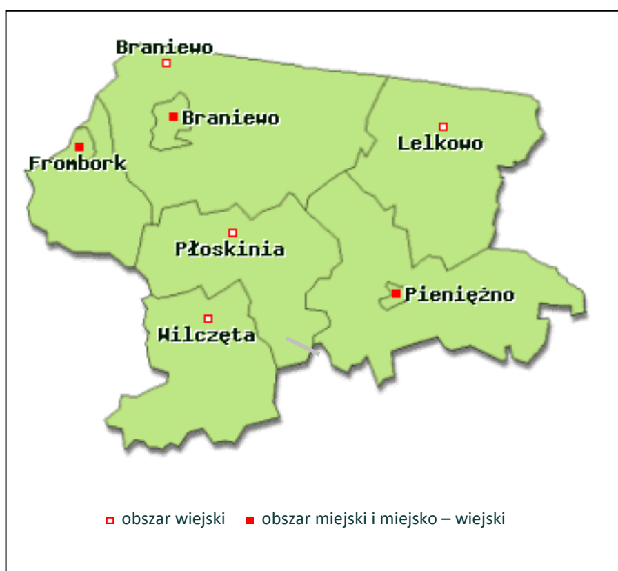
Rys. nr 1. Miasto i Gmina Pieniężno na tle powiatu braniewskiego – mapa administracyjna

Obszar miejsko-wiejski miasta i gminy Pieniężno położony jest w północno-zachodniej części województwa warmińsko-mazurskiego, południowo-wschodniej części powiatu braniewskiego. Od zachodu graniczy z Gminą Płoskinia, od północnego zachodu z Gminą Braniewo, od północy z Gminą Lelkowo, od północnego wschodu z Gminą Górowo Iławeckie (powiat bartoszycki), od południa z Gminą Orneta oraz Gminą Lidzbark Warmiński (powiat lidzbarski).