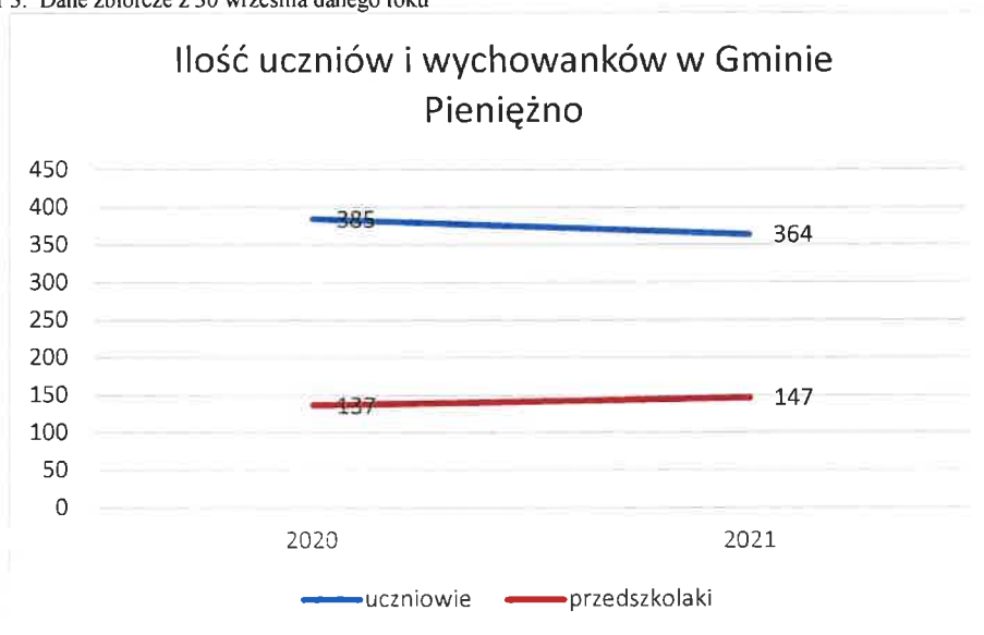
Wykres nr 3. Dane zbiorcze z 30 września danego roku

Porównując liczebność uczniów nie tylko w poszczególnych szkołach ale w całej gminie należy przypuszczać, że w kolejnym roku „oświata” będzie jeszcze bardziej obciążać budżet Gminy ponieważ subwencja zależy tylko od ilości uczniów na terenie całej Gminy.