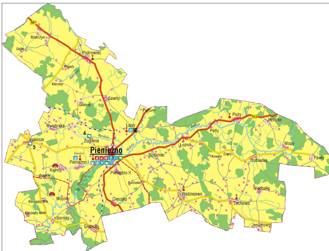
Rys. 2 Mapa gminy Pieniężno

Na system osadniczy gminy składa się 39 miejscowości. Charakteryzuje się on znaczną zwartością niewielkich wsi położonych w niedużej odległości od siebie – od 3,5 do 7km. Na terenie gminy znajdują się 24 sołectwa. Rolę ośrodka gminnego pełni miasto Pieniężno, które jest największą miejscowością gminy. Miasto jest centralnie położone w stosunku do całości gminy i do niego dostosowany jest układ komunikacyjny. Stanowi ono główne i centralne miejsce na mapie gminy.