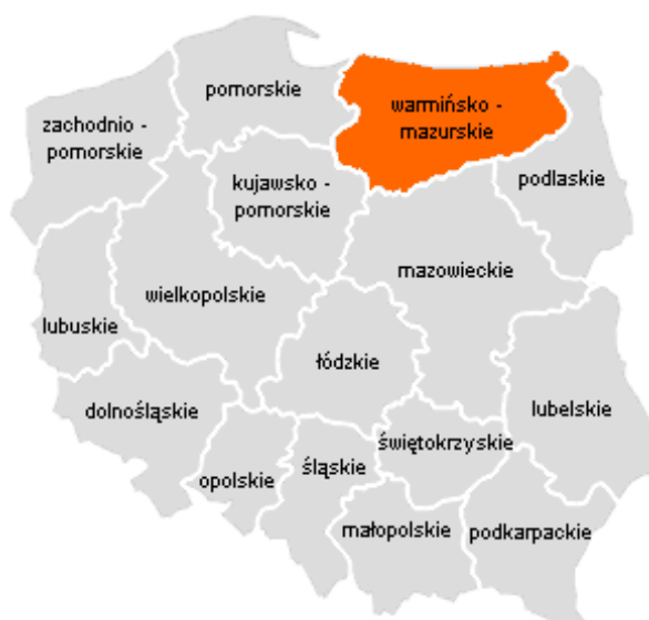
Rys. 4. Mapa położenia Województwa Warmińsko – Mazurskiego w Polsce.