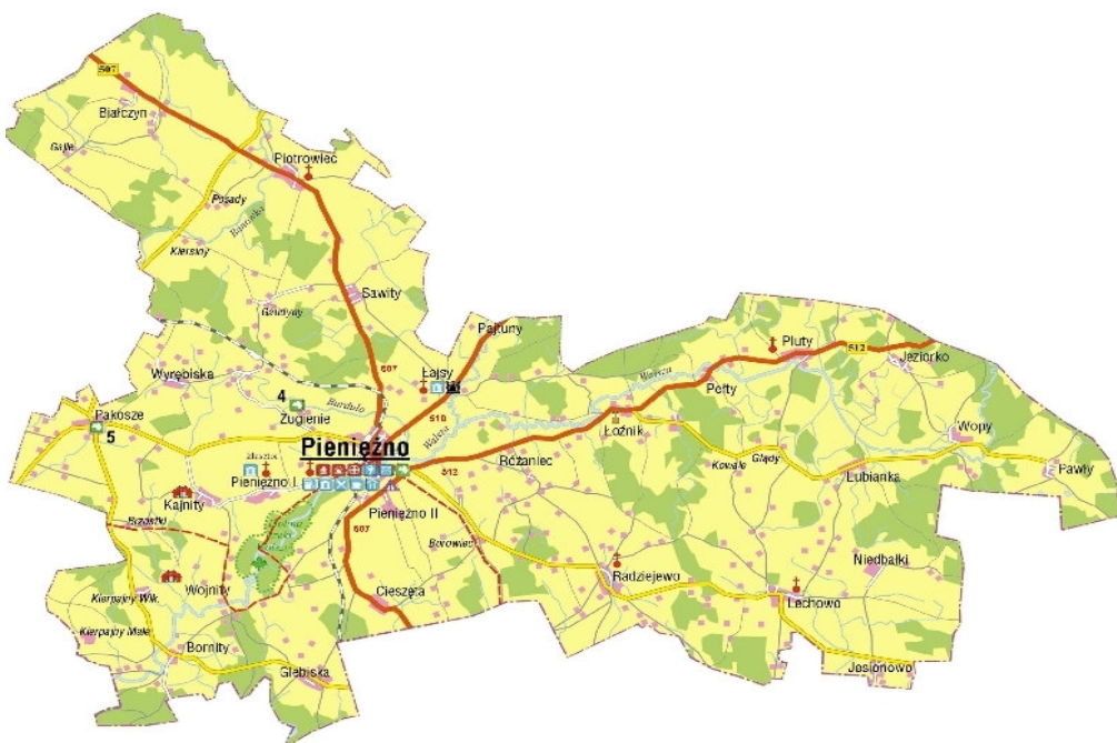
Rys. 2. Lokalizacja Gminy Pięczęno