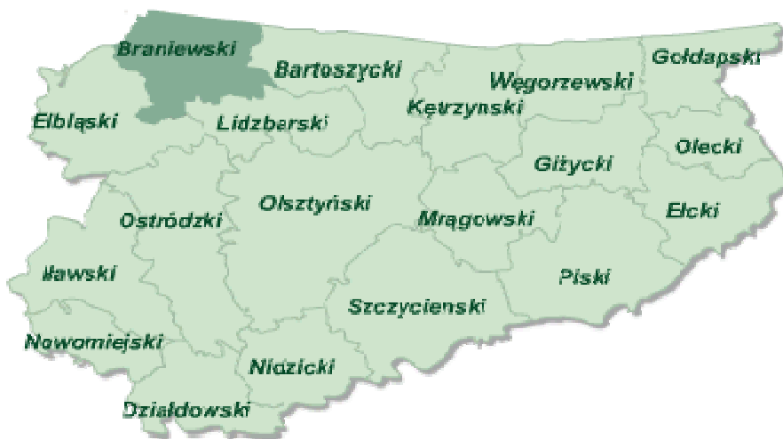
Rys. 3. Mapa powiatów woj. Warmińsko – Mazurskiego.